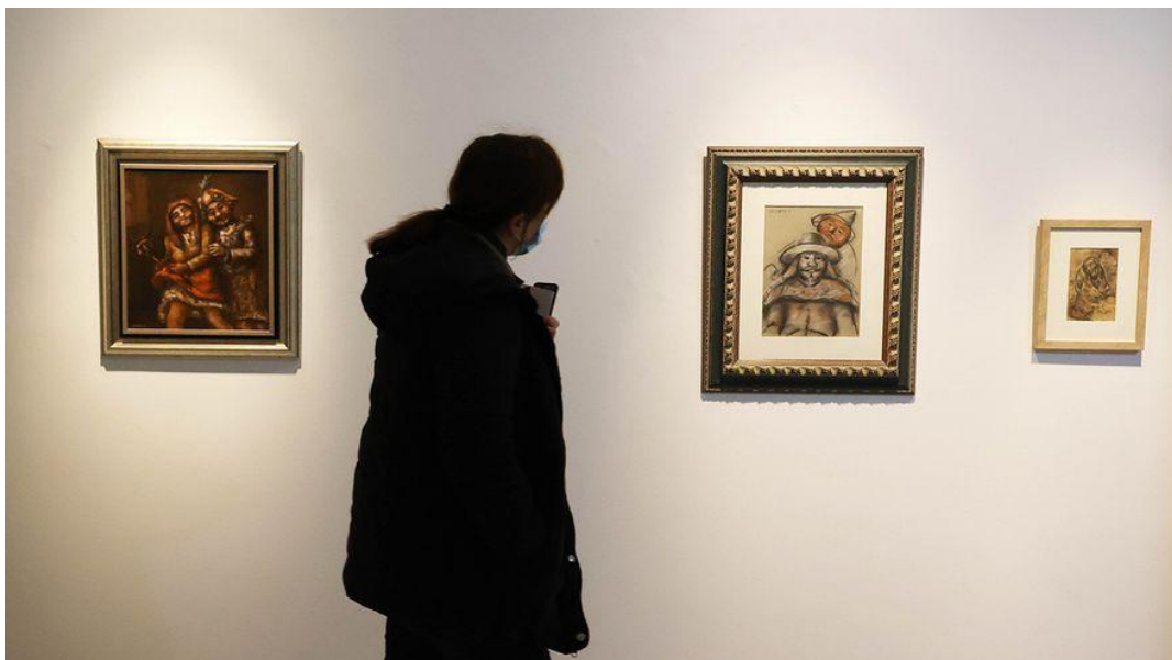
Exposición "Laxeiro descoñecido I. Obras inéditas da primeira época" en la Fundación Laxeiro de Vigo. ALBA VILLAR

La obra cobra fuerza en este año de Laxeiro, al que se le ha dedicado el Día das Artes Galegas, el pasado 1 de abril. Hasta el 5 de junio permanece abierta en la Fundación Laxeiro de Vigo "Laxeiro desconocido I", con obras inéditas de la primera época y comisariada por el director, Javier Pérez Buján.