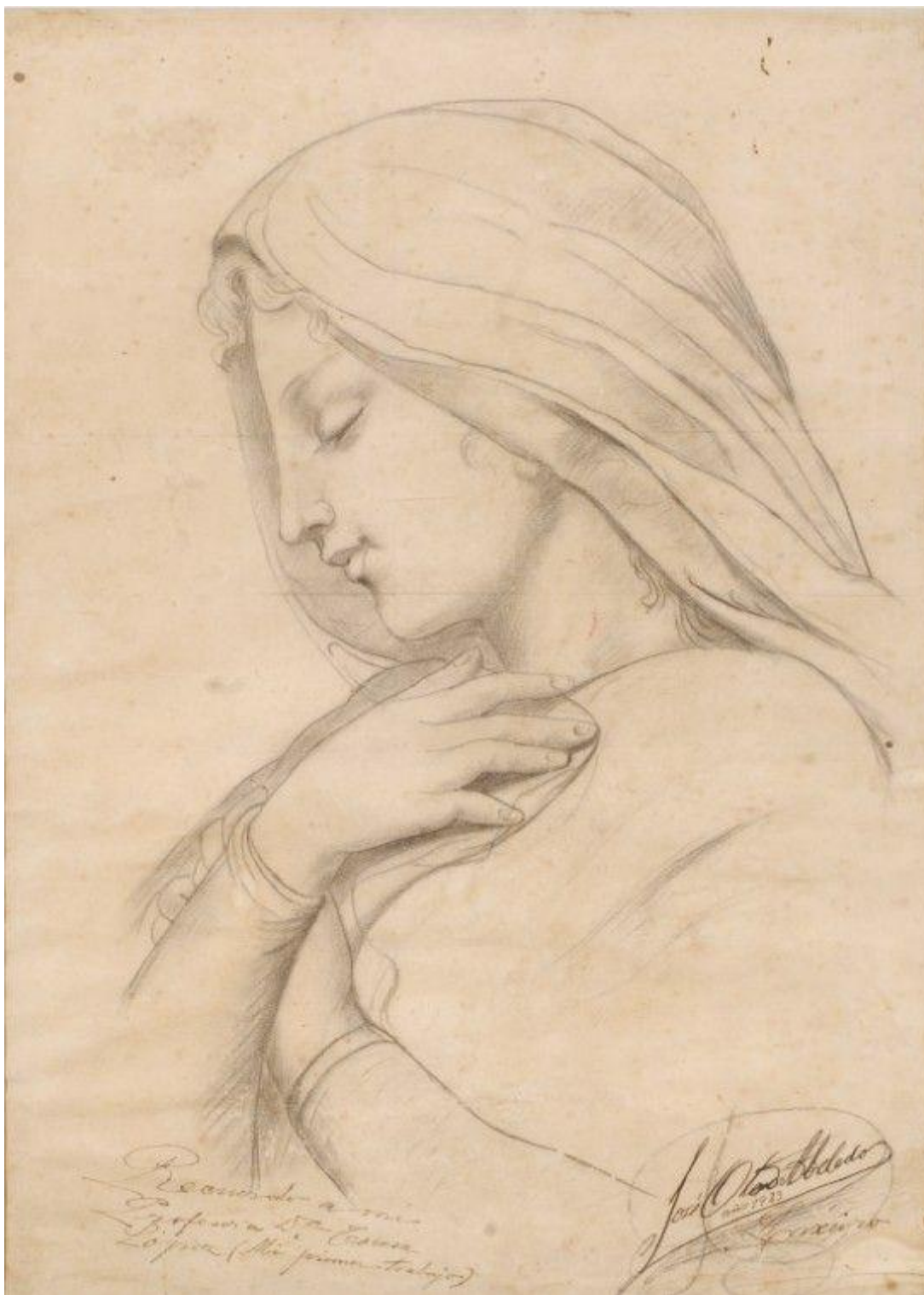
El cuadro de la Virgen de Laxeiro.