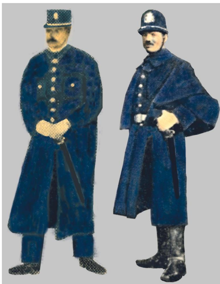
Gardas municipais Vigo 1911 e 1913

Cabe que non podemos achegar moitos datos sobre a situación socioeconómica dos gardas municipais de Cangas, mais, salvando as distancias lóxicas e escasamente extrapolables á nosa vila por cuestión de teren máis recursos e plantel, son significativos os datos sobre as circunstancias polas que pasaba este corpo en Vigo nestas datas e que poden aproximarnos á realidade destes axentes cuxo “estatus” social non era moi distinto ao doutros funcionarios públicos como mestres ou gardas civís. Nesta cidade, un garda municipal de segunda gañaba 3’15 pesetas diarias e un de primeira 3’50, que viñan sendo 100’50 e 105 pesetas, respectivamente. Se se deducían 23 pts. do aluguer da casa e as 10 pts do pagamento (a prazos) do uniforme, quedábanlle 72’50 pesetas que resultaban insuficientes para vivir na cidade unha familia, aínda que só estivese composta do matrimonio e dous fillos, caso rarísimo. O do uniforme era tamén chamativo