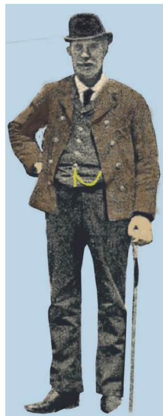
1877 Garda Municipal. Os primeiros gardas municipais nas vilas galegas só tiñan como identificativos da autoridade a chaqueta e a cachoporra como arma disuasoria.