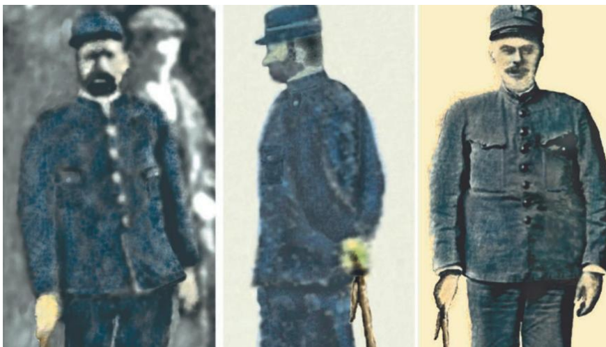
Gardas municipais de Cangas en 1901 e 1910 extraídos de fotos da época e un garda doutro concellos galego con uniformidade semellante.