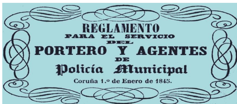
A portada do regulamento para o servizo de porteiro e axentes da Policía Municipal da Coruña, no ano 1845.

variopintos e pomos como exemplo a Garda Municipal de Sevilla que nace en 1843, pola impasibilidade e, xa que logo, imposibilidade dos serenos para controlar os numerosos roubos nos establecementos da cidade. Mais, para ampliar o seu contexto histórico en Galicia, imos incluír algunhas referencias ao nacemento dalgúns destes corpos locais que teñen como especificidade a súa exclusiva dependencia dos alcaldes, a concreción das súas funcións (difusas) e o seu ámbito de actuación, restrinxido ao territorio municipal.