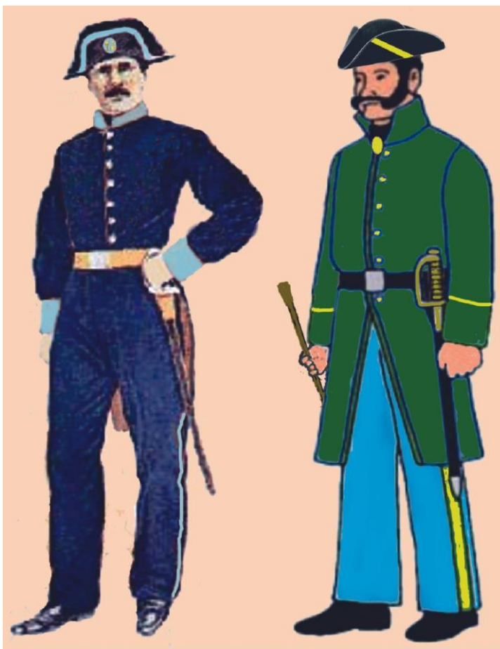
Gardas Municipais de Santiago e Pontevedra cos seus uniformes e armamento na súa fundación no século XIX.

Hai que constatar que moitos dos procesos fundacionais dos numerosos corpos de vixilancia e segurancia locais, nados nestas datas decimonónicas, non contan con moitas referencias, o que dificulta fixar a súa nacemento e o seu seguimento ao longo da historia. Tamén os motivos da súa creación son