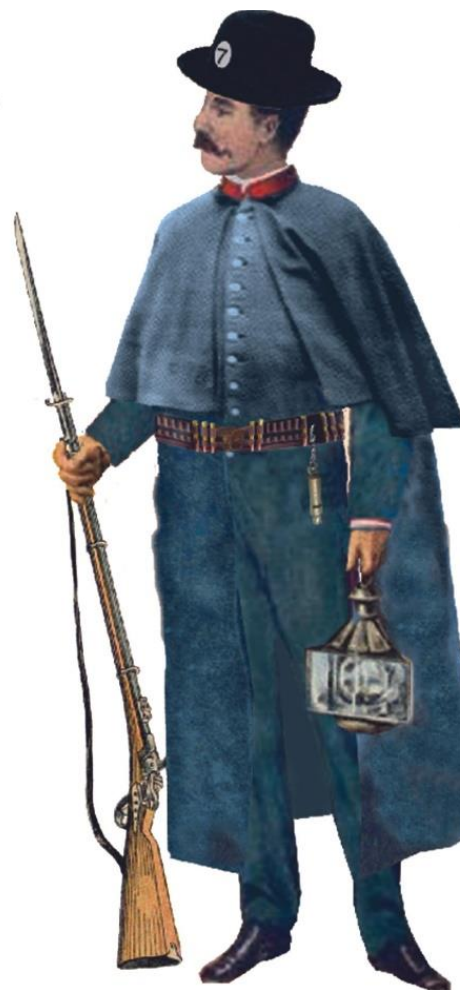
O uniforme e armamento dun sereno na cidade de Santiago.

Art. 4°. El Sereno además del chuzo de que se sirve, podrá usar de armas de fuego, pero con espresa licencia del Presidente del Ayuntamiento, que concederá si lo tuviese por conveniente á propuesta del Capataz. Llevará también el pito