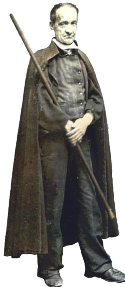
Un alcalde de barrio, no ano 1839.

Unha das primeiras urbes galegas (20.000 h.) que implantou os alcaldes de barrio foi A Coruña un ano despois (agosto de 1769), perfeccionando as súas misións e dotándoos dun regulamento en xaneiro do ano 1839 no que se indica que contan co auxilio dos celadores de rúa polo día e dos chamados serenos pola noite, cuxo regulamento se redactaría en setembro deste mesmo ano. Estas dúas figuras da orde aparecen como o xérmolo do que logo serían os gardas municipais, denominación que vai perdurar durante anos, aínda que administrativamente van ser denominados como Policía de Seguridad para diferencialos do que se viña chamando policía urbanística, a cargo dun concelleiro, referíndose aínda a palabra policía (gr. politeia) ao decoro, a limpeza e aos costumes dentro das poboacións.