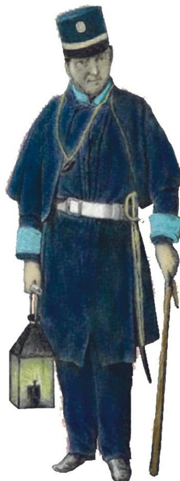
O uniforme e armamento dun sereno na cidade da Coruña.

Na súa misión de rondar de noite os distritos ou barrios correspondentes, dependían dun xefe ou capataz e portaban un chuzo, sabre ou chafarote, un subioto pendurado do pescozo, e farol de aceite. Nalgúns momentos de axitación social ou incremento da delincuencia podían portar armas de fogo lixeiras, sendo que os serenos de Santiago chegaron a substituír o chuzo por unha carabina con baioneta. Asemade, deberían cantar as horas e as condicións meteorolóxicas: sereno, nubrado, chuvioso, vento, treboada ou neve e axudarán a deter delincuentes do alleo. Coidarán o alumado público e das fontes, axudarán aos veciños na procura de médico, medicinas e parteiras, avisarán dos incendios e rematarán os seus anuncios cun “Ave María”, frase suprimida nos periodos dos gobernos progresistas.