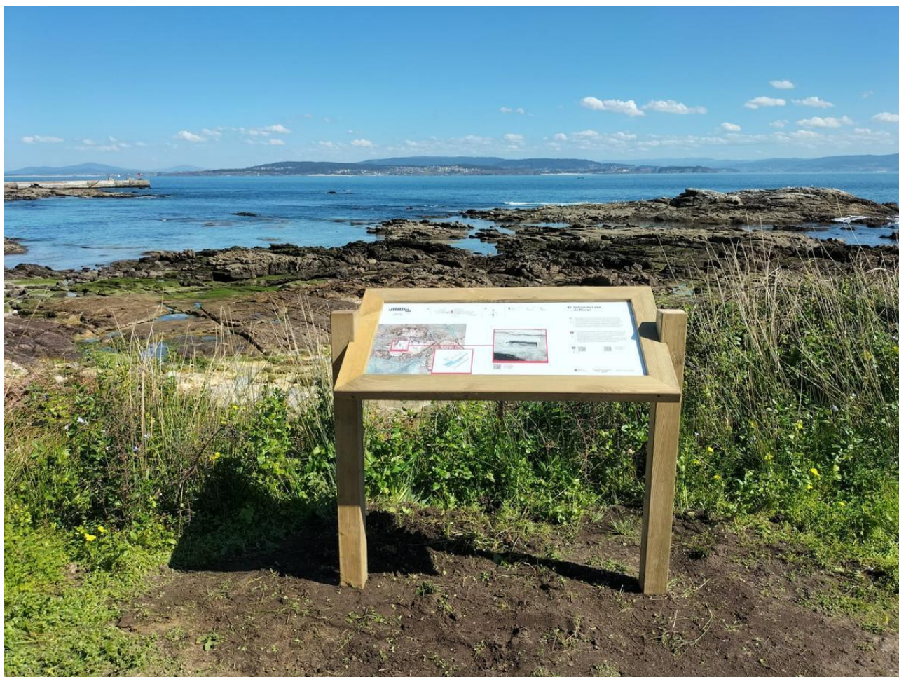
Un panel informativo de la ruta o vía dos múrices en Ons, situado en la zona del Con de Laxe do Crego.

El tinte se obtenía de la extracción del hepatopáncreas de un molusco llamado múrice (también se conoce por los nombres de cañadilla o cañaílla) y de nombre científico Stramonita haemastoma , que tenía que ser extraído con sumo cuidado para no dañarlo . “Es un descubrimiento de gran importancia porque se trata del primer taller de este producto documentado en la Península Ibérica. Por tanto, se optó por denominar a la ruta arqueológica como ‘Vía dos Múrices’”, argumentan desde Medio Ambiente y el parque nacional.