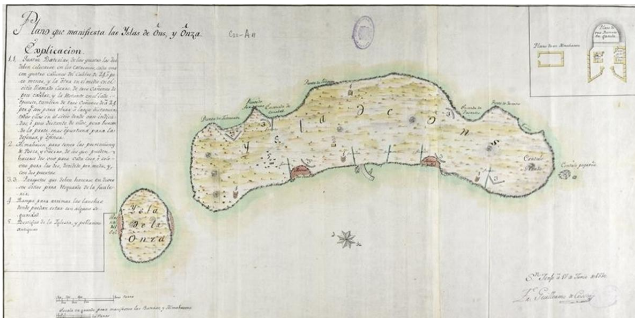
Plano digitalizado del Archivo do Reino de Galicia (accesible en Galiciana) donde se detalla el plan de construcciones de defensas de Ons

La “Vía dos Múrices” será un recorrido de 5,5 kilómetros , con paneles informativos que incluirán códigos QR para que los visitantes puedan conocer los avances en las investigaciones sobre la ocupación antigua de la isla. La ruta estrena también un logotipo, que consta de una serie de cuadrados que recrean el contorno de Ons y que al mismo tiempo aluden a los pilos de las salazones romanas de Canexol y a las estructuras residenciales del Castelo dos Mouros. Desde las salazones de Canexol se exportaban conservas de pescado, aprovechando la riqueza de las rías . Unas conservas que se envasaban en toneles o en ánforas. En ánforas como las que se fabricaban en Pescadoira , en lo que hoy es el centro urbano de Bueu, y donde está documentado que existía una industria alfarera.