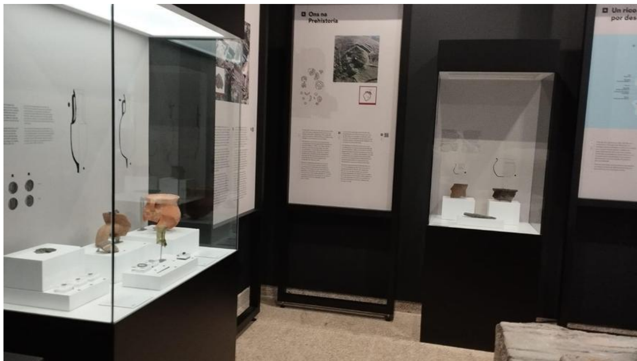
El interior de la nueva sala arqueológica de Ons, ubicada en el centro de visitantes de la isla.

La isla tenía un punto de producción industrial en Canexol y hasta la fecha no se conoce otro igual | Parques ofrecerá visitas guiadas en Semana Santa por los principales puntos de interés arqueológico, una ruta de 5,5 kilómetros