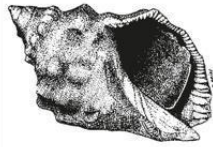
* Múrice: Strombathys armatus