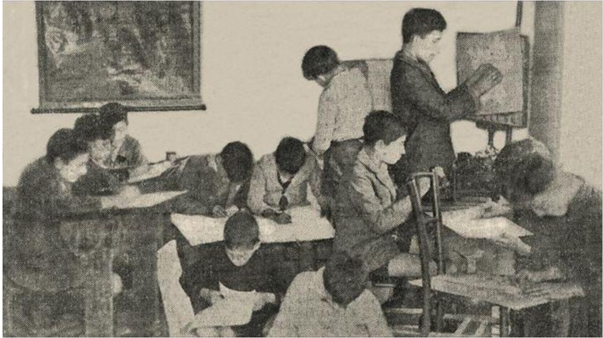
Imaxe da escola número 2 de Cangas, tomada no ano 1930.