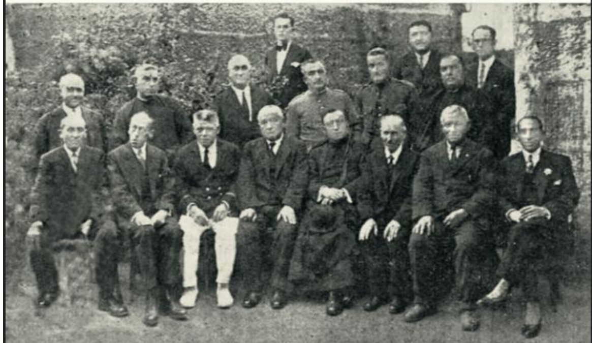
Ocaña FIN DE CURSO NA ESCOLA DE MONGE EN 1930, CON ALUMNOS PREMIADOS E AUTORIDADES ASISTENTES.

Entanto, a implantación dos pósitos e o apoio da Ditadura, que os vía como supletorios das suspendidas asociacións mariñeiras e obreiras, vai cobrar novos pulos nestas datas e en xullo de 1926 abre a escola do pósito Aldán-Hío e en decembro deste mesmo ano as de Coiro no Forte e a de Darbo no Piñeiro. Nestas datas, o control dos pósitos corría da man dos axudantes de Mariña e o de Cangas, Carlos de la Piñera, vai destacar por promover a Fiesta del Niño Pescador para recadar cartos para os fillos de mariñeiros pobres ou entregarlles libretas de aforro. Aínda que nestas datas non se levaban as estatísticas, sabemos por un informe de outubro de 1926 que á escola de nenas de Aldán asistían 78 alumnas que supuñan un 80% das matriculadas, que á do Hío, tamén de nenas con 97 alumnas inscritas, só ían a metade (50%) e que a nº 2 de Cangas con 72 alumnos tiña unha asistencia