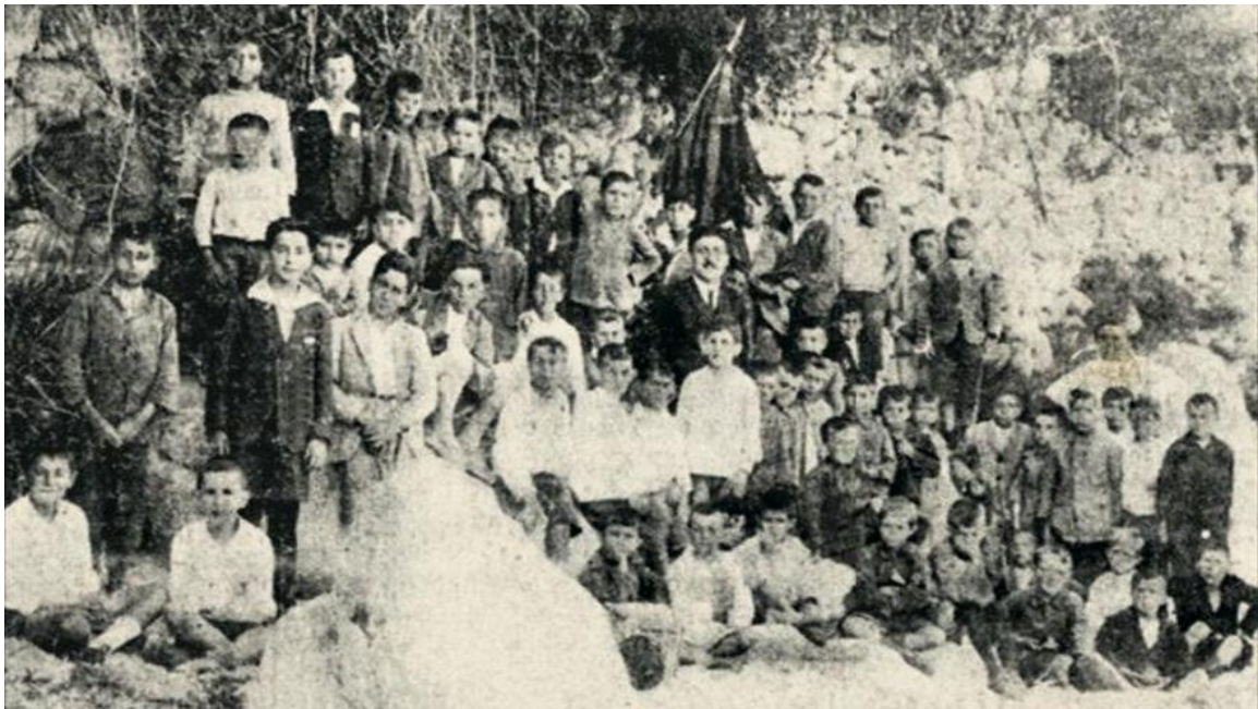
Excursión á praia por parte da escola de Monge. Xullo de 1926

escolas Normais foi continuista co cal a base do sistema educativo seguiría a resentirse e a permanecer en precario ata a chegada da República.