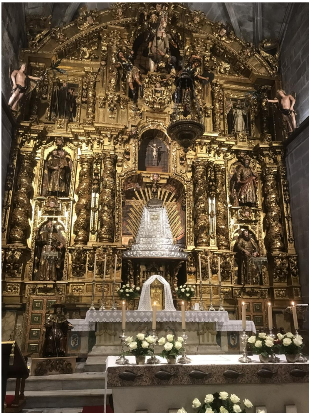
Retablo da Igrexa de Cangas co baldaquino de prata.

Co tempo, en Cangas as imaxes deixaron de procesionar polas nosas rúas e no seu lugar saían os seus respectivos estandartes para renderlle homenaxe; tradición que perdurou na nosa vila ata o ano 2019 e que despois da COVID non se volveu recuperar, saíndo na actualidade soamente o Santísimo Sacramento. Non obstante, cómpre eloxiar o traballo das veciñas e veciños da nosa vila que ano tras ano traballan na realización desas alfombras e tapices florais para que sobre eles procesione o Corpus Christi, no que podemos describir como patrimonio inmaterial da nosa vila; que debemos de manter, coidar, e, por suposto, presumir.