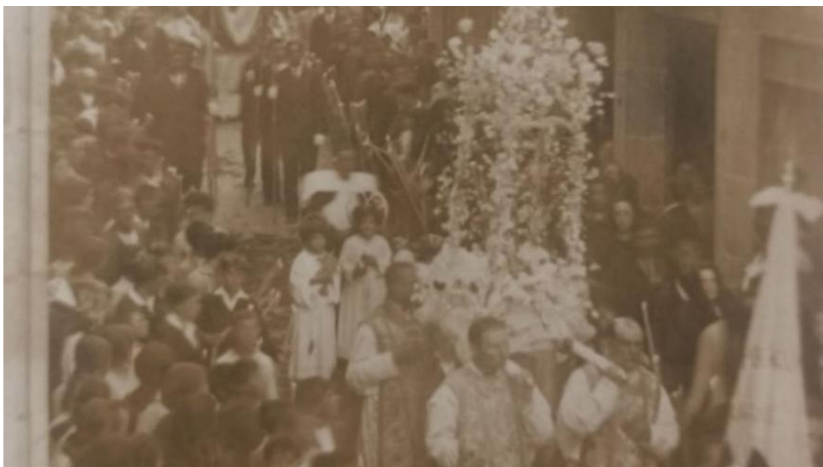
Imaxe da Custodia co Santísimo en anda 1932.

Hai constancia de que antes do 1629, as mulleres do gremio de panadeiras e regatonas bailaban na procesión