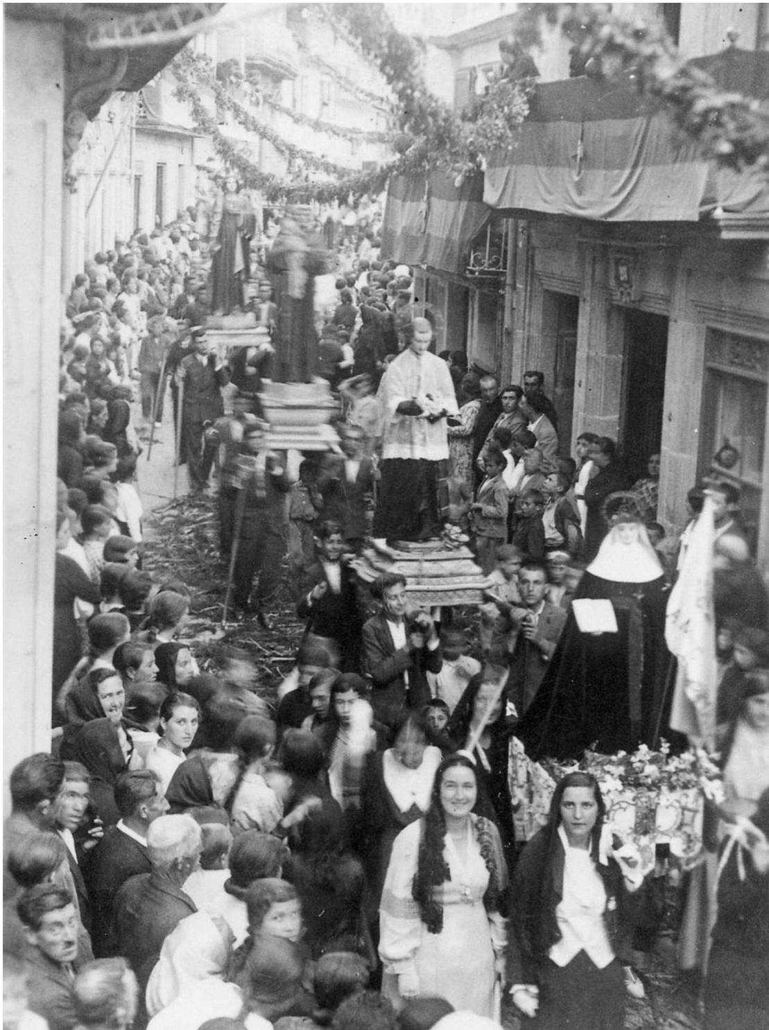
Procesión do Corpus con Santa Xoana, San Luis, San Antonio, Santa Lucía e estandartes e pendóns. 1932.

No que respecta ás alfombras florais e altares que na actualidade se dispoñen pola nosa vila, non temos referencias ao momento no que se comezan a realizar, posto que ao ser algo habitual nesta celebración non se deixa por escrito na documentación, mais si que podemos apuntar que a primeira referencia dunha alfombra floral en Galicia xorde en Ourense, no ano 1323. O mesmo sucedía coas danzas, das que soamente temos pequenas referencias debido ao xurdimento de conflitos que fixeron que quedara recollido por escrito esa tradición.