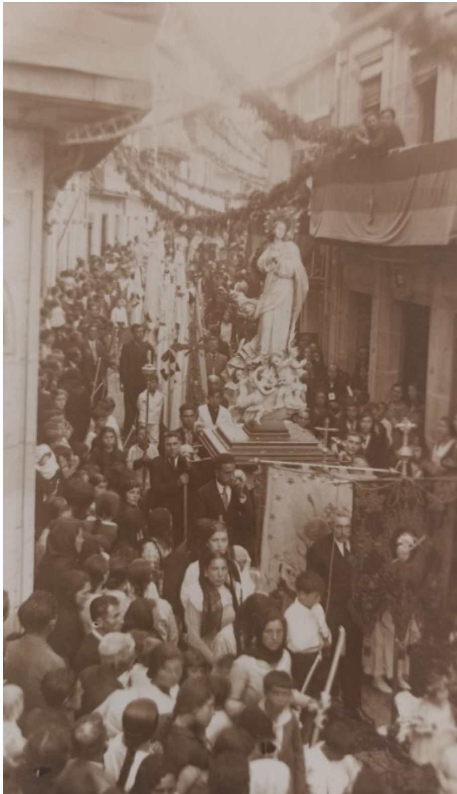
Procesión do Corpus coa Inmaculada e rúas adornadas 1932.

O percorrido desta procesión posiblemente se manteña case inalterado dende que se funda a parroquia. Isto podémolo deducir do feito de que coa procesión de Corpus o que se pretendía era sacar ao Santísimo polas rúas da vila e esta procesión recorre no noso caso case a totalidade da zona habitada da Cangas do século XVI, o Señal e o Costal. Neste sentido, iníciase a procesión na colexiata e recorre as rúas ata o Cruceiro do Señal (hoxe movido de sitio) e despois vai ata Sínqulis, a parte alta da vila, para volver de novo á Colexiata.